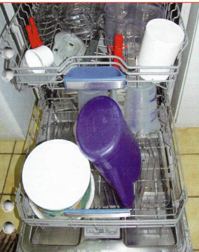
Alle Gebrauchsutensilien wie Tränken, Futterrinnen, Nistschalen usw. werden regelmäßig im Geschirrspüler gereinigt.