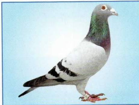
08660-06-22 blau V Nachzucht aus "576"; mit verschiedenen Weibchen fliegen Söhne und Töchter mehrere 1. Konkurse.