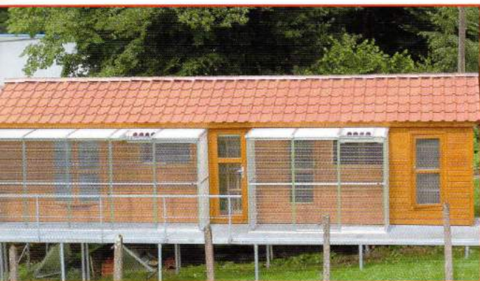
Die Taubenschläge befinden sich auf dem elterlichen Grundstück, unterteilt in Zucht- und Reiseschläge.